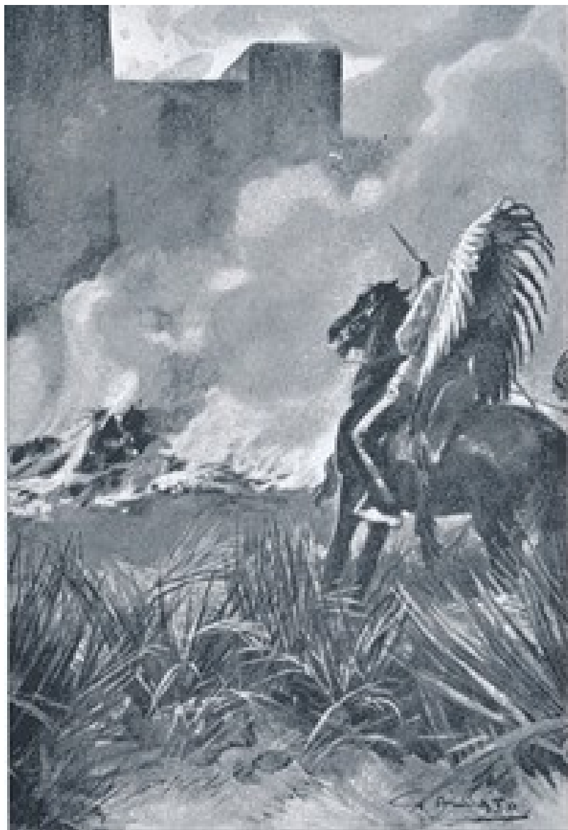
Gli uomini bianchi depongono le armi nelle mani di Nube Rossa...