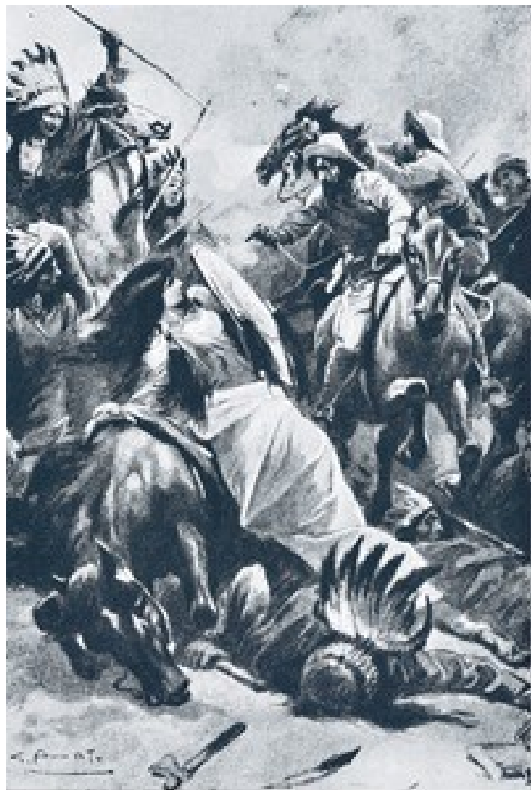
La Scotennatrice, crivellata di palle, lasciò cadere il suo scudo...